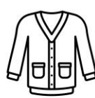
【カーディガン】 (白・紺)